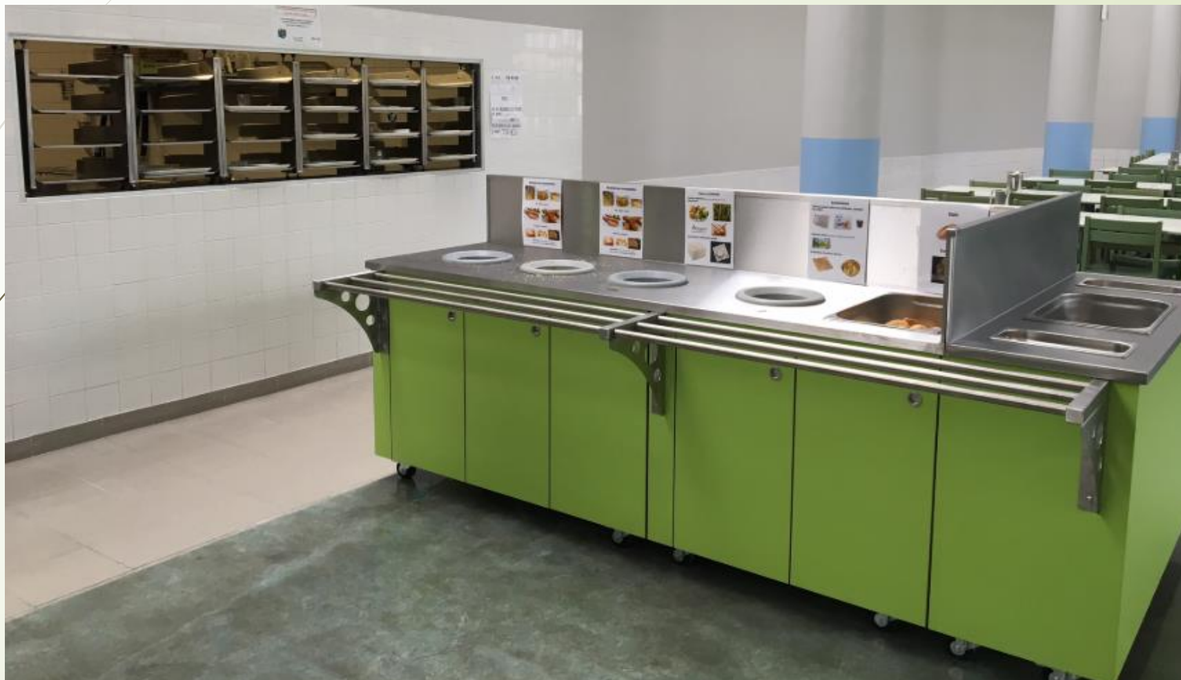
Table de tri à la cantine